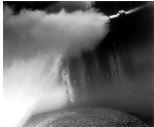
Het afblazen van blusgas bij brand

Blootstelling boven een bepaalde concentratie aan blusgas veroorzaakt nadelige effecten. De aard van deze nadelige effecten en de mate waarin deze optreden zijn afhankelijk van de stof en de concentratie die wordt ingeademd.