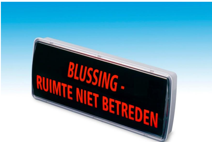
Voorbeeld van een bluswaarschuwingspaneel

Omdat goede en tijdige alarmering zo belangrijk is, moeten de alarmsignalen goed hoorbaar en/of zichtbaar zijn in de gehele ruimte en bij de toegangen tot de door een blusinstallatie beveiligde ruimte. De signalen moeten duidelijk te onderscheiden zijn van de overige signalen en geluiden die in de beveiligde ruimte voorkomen (zie NEN 2575).