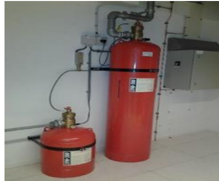
Chemische blusgassen in computerruimte

De gevaren, verbonden aan de toepassing van 'clean agent' blusgassen, zijn niet voor alle blusgassen gelijk. De wijze waarop het blusgas het menselijk lichaam kan beïnvloeden en de concentratie van dat gas in de lucht waardoor die beïnvloeding plaatsvindt, lopen sterk uiteen. Voor alle blusgassen zijn grenswaarden bepaald die een indicatie geven van de concentraties 'clean agent'-blusgas in de lucht, waarbij de invloed op het menselijk lichaam merkbaar wordt. Men noemt deze de NOAEL-waarde en de LOAEL-waarde.