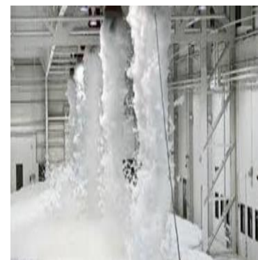
Hi-Ex blusschuim installatie

De meeste schuimconcentraties zijn geschikt om in Hi-Ex outside air blusinstallaties te worden toegepast.