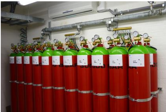
Een inerte blusgasinstallatie

De veiligheidsvoorzieningen voor besloten ruimten moeten er altijd op gericht zijn te voorkomen dat blusstof in de beveiligde ruimte wordt geblazen als zich daarin personen bevinden. Dit betekent dat deze systemen worden ingedeeld in klasse III met aanvullende wijzigingen.