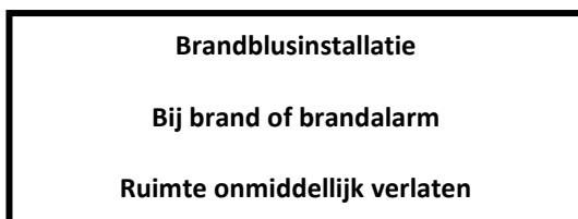
Waarschuwbord voor toegangen

In de NEN 3011 staan de afmetingen van lettertypes en te gebruiken kleuren gespecificeerd. Deze schrijven rode kleur met witte letters voor brandveiligheid.